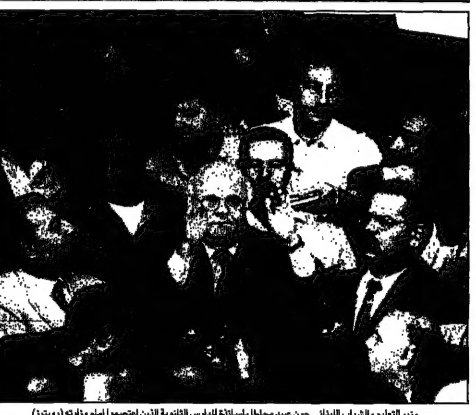
وزير التعليم والديان البياتي جون عينا سلفا بإسنادة المجلس الثاني التعليمي انتموا امام وزيرا (يمين)

■ الناصرة - فازت ائتلاف القوى الإسلامية في الانتخابات التشريعية التي أجريت في الناصرة في 17 كانون الثاني/يناير 1998، وذلك بعد أن حصل على 12 مقعدا من أصل 25 مقعدا في المجلس البلدي. وقال مسؤولون في اللجنة المراقبة إنهم لم يلقوا حتى الآن أي معلومات عن هجمات إسرائيلية على معقل حزب الله في جنوب لبنان، وذلك في أعقاب قيام إسرائيل بإطلاق النار على معقل حزب الله في جنوب لبنان في 10 شباط/فبراير 1998. وقال مسؤولون في اللجنة المراقبة إنهم لم يلقوا حتى الآن أي معلومات عن هجمات إسرائيلية على معقل حزب الله في جنوب لبنان، وذلك في أعقاب قيام إسرائيل بإطلاق النار على معقل حزب الله في جنوب لبنان في 10 شباط/فبراير 1998.